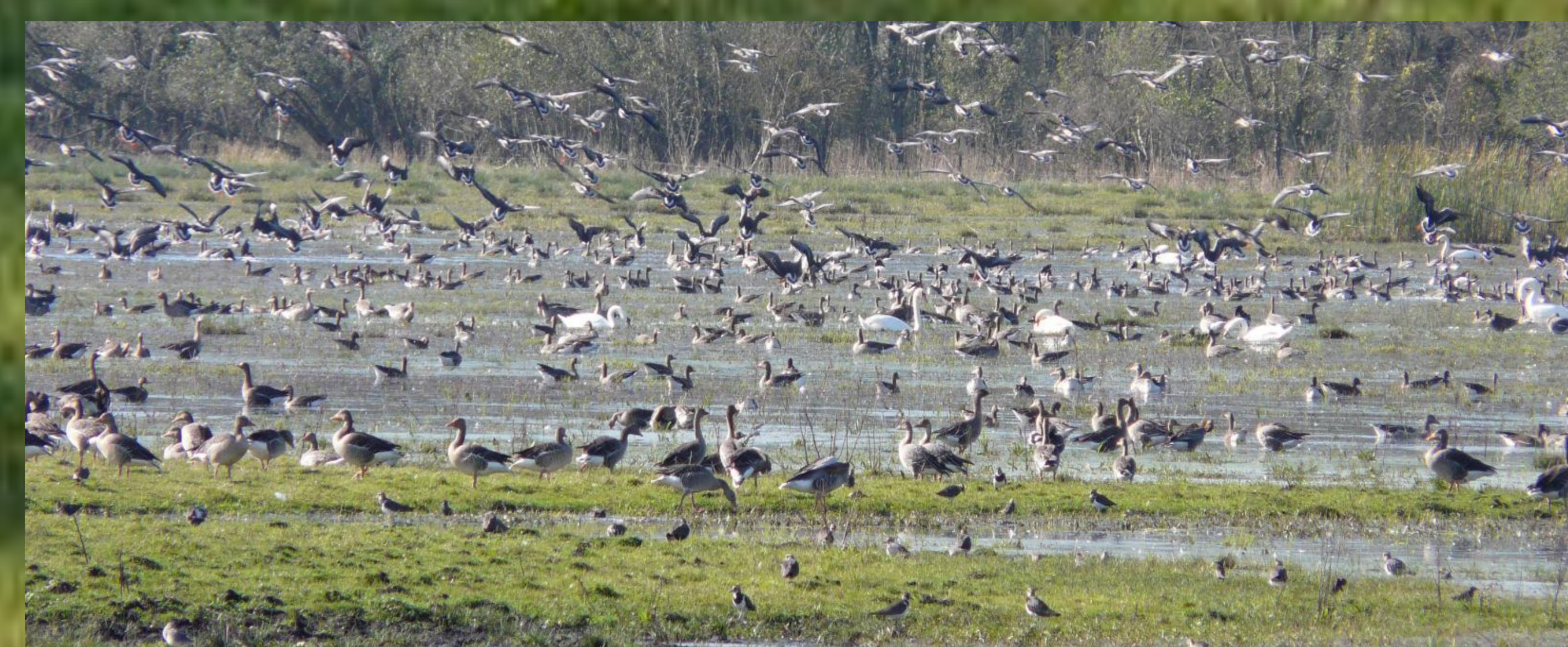
Zahlreiche Durchzügler, hier Graugänse und Kiebitze, nutzen die Kompensationsfläche