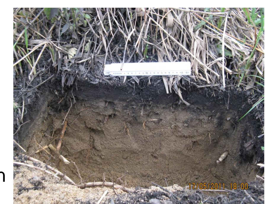
Sedimentschicht auf Filtersubstrat eines RBF (MUNLV, 2015)