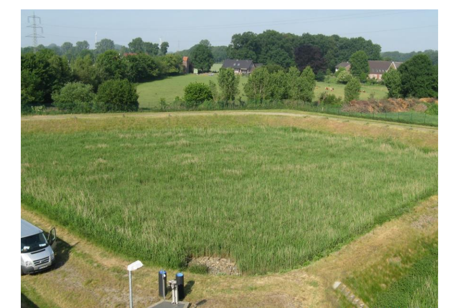
Filteraufbau eines RBF (MUNLV, 2015)