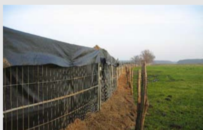
Biotopschutzzaun für angrenzende Feuchtwiesen sowie Sichtschutzfolie gegen Störwirkungen auf Wiesenbrüter