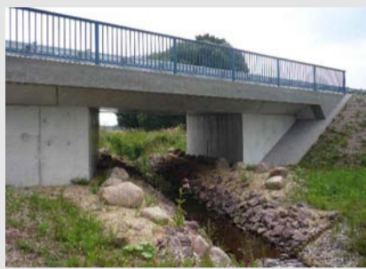
Erneuerte Brücke über die Funder mit Gewässerprofilierung aus Stein- und Kies-/Sandschüttungen insbesondere für Fischotter, Biber und Bachneunauge.