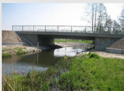
Erneuerte Brücke über den Königsgraben mit größerer lichter Weite und beidseitig hochwasserfreien, tierartgerecht gestalteten Bermen als Querungshilfe für Fischotter, Biber und Amphibien.