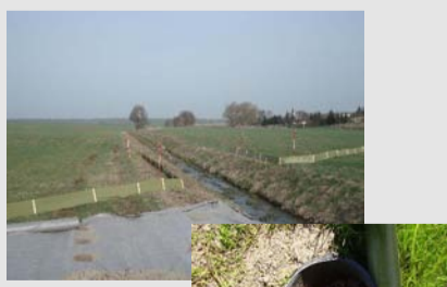
Temporärer Amphibienschutzzaun um das Baufeld

L 82, BW 5, Ersatzneubau Brücke über die Funder bei Niemegk L 96, BW 8, Ersatzneubau Brücke über den Königsgraben bei Böhne