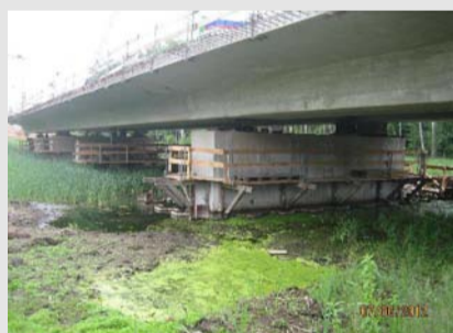
Die Brücke wurde im Taktstiebefahren errichtet. Durch den Verzicht auf Baustraßen und Dammschüttungen wurde die Flächeninanspruchnahme des Feuchtlebensraums so gering wie möglich gehalten. Verbundbeziehungen hochgradig schutzbedürftiger Amphibien, Vogelarten und Säuger bleiben aufrechterhalten.