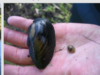
Vor Beginn des Baus der Behelfsumfahrung wurden die Muscheln mit einem Käscher entnommen und außerhalb des Einflussbereichs der Baustelle wieder in den Graben eingesetzt.