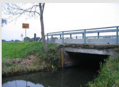
Alter Zustand der Brücke über den Königsgraben, ohne Bermen