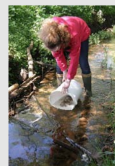
Unmittelbar vor Beginn des Baus der Behelfsumfahrung wurden im Eingriffsbereich Fische und Rundmäuler in mehreren Durchgängen mittels Elektrofischung und zusätzliches Durchharken des Sediments entnommen, quantitativ erfasst und ca. 800 m bachaufwärts wieder ausgesetzt. Die Maßnahme diente insbesondere dem europarechtlich geschützten Bachneunauge.