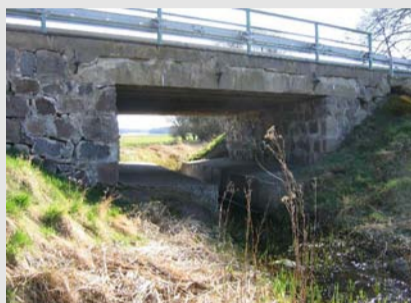
Alter Zustand der Brücke über die Funder mit betonierten, rechteckigen Bermen

L 82, BW 5, Ersatzneubau Brücke über die Funder bei Niemegk L 96, BW 8, Ersatzneubau Brücke über den Königsgraben bei Böhne