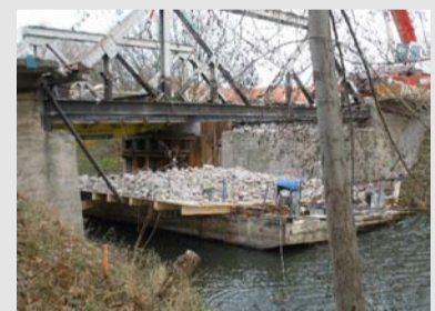
Um das Abbruchmaterial aufzufangen und so eine Beeinträchtigung des aquatischen Lebensraums zu vermeiden, wurde bei der Funderbrücke eine Holzplattform auf den Bermen installiert. Unter die Stremmebrücke wurde eine Schute mit aufmontierter Holzplattform geschoben.