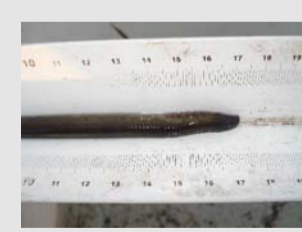
Bachneunauge ( Lampetra planeri )