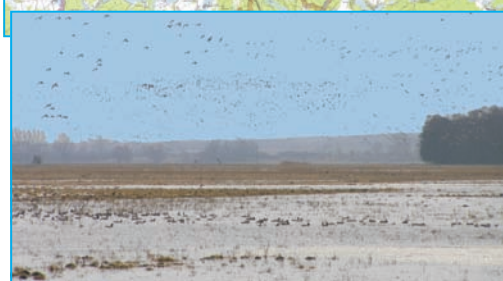
Die renaturierten Koblenzter Seewiesen bilden zusammen mit benachbarter NSG Koblenzter See einen wichtigen Trittstein im europäischen Vogelzug.