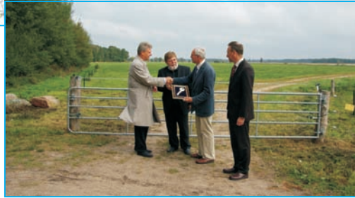
BMVBS, Land Mecklenburg-Vorpommern und DEGES übergeben die Unterhaltung dauerhaft an die Stiftung Umwelt und Naturschutz Mecklenburg-Vorpommern im September 2009