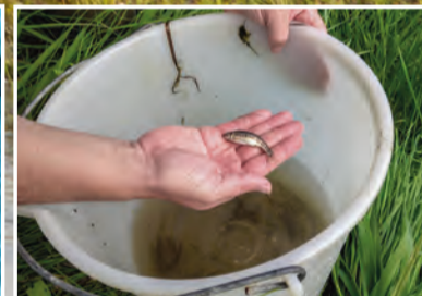
Elritze - Wirtsfisch der Bachmuschel