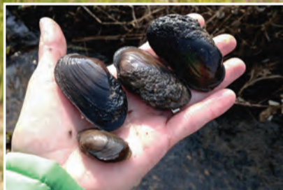
Bachmuscheln aus dem Mühlbach