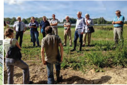
Führung mit dem Projektbegleitenden Arbeitskreis