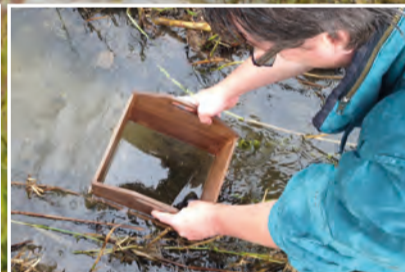
Muschelbergung mittels Schaukasten