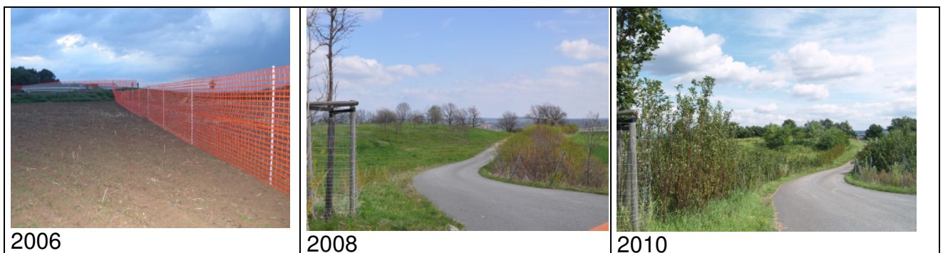
Abbildung 3: Leitstruktur zu einer Heckenbrücke

Bereits ein Jahr vor Baubeginn der Trasse und während des Autobahnbaus wurden zahlreiche Gehölzstrukturen, Bachauen und Feldgehölze als vorgezogene Maßnahmen angelegt, um die Fledermäuse gezielt zu den sicheren Querungshilfen zu leiten. In der Übergangsphase zwischen Pflanzung und Etablierung einer gut geschlossenen Heckenstruktur wurden temporär Zäune eingesetzt.