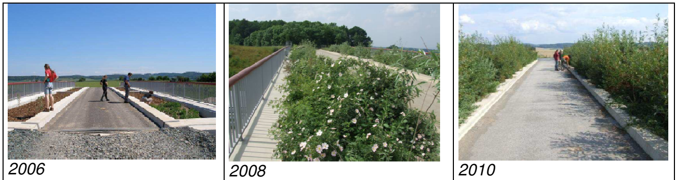
Abbildung 1: Begrünte Feldwegebrücke

Durchlässe wurden angeordnet, wo die Gradiente es zuließ. Dabei wurden u. a. Wellstahlprofile als Fertigteile eingesetzt. Diese Bauwerke ermöglichen den Fledermäusen ein gefahrloses Über- bzw. Unterqueren der Autobahntrasse auf ihren Flugwegen zwischen Quartieren und Jagdgebieten.